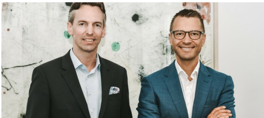
Bild: © Josef Resch und Wolfram Huber haben die Transaktion betreut. Foto: PHH Rechtsanwälte Autor: red